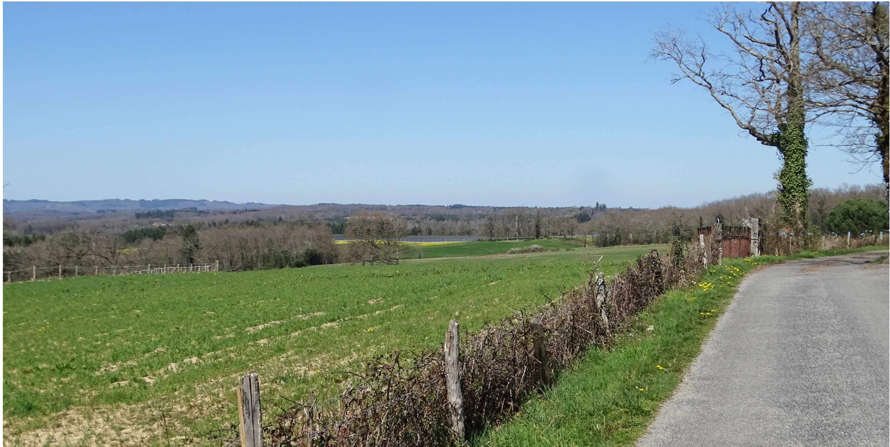
PV3 - Photomontage depuis le sud du projet, au lieu dit «les Palins» - avec mesures paysagères