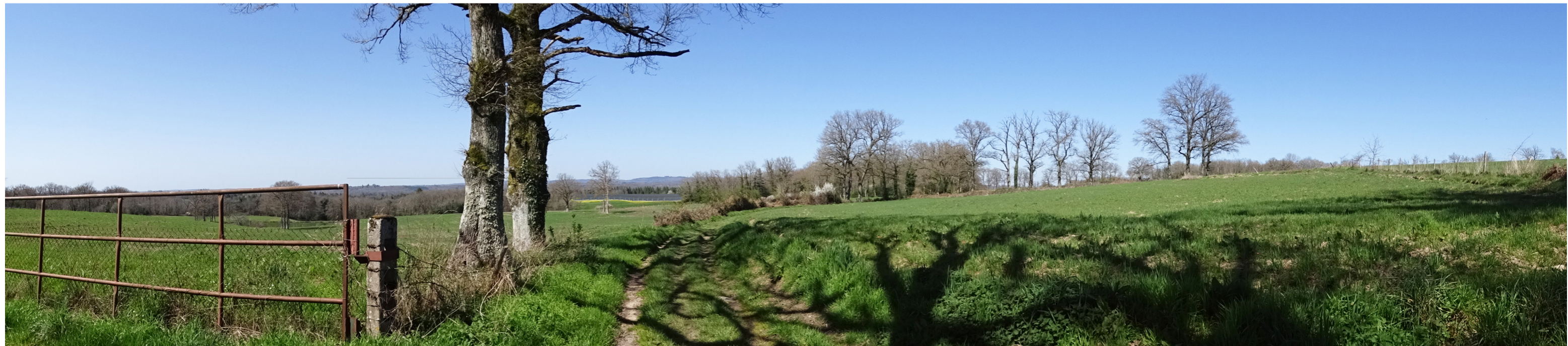
PV4 - Photomontage depuis le sud du projet