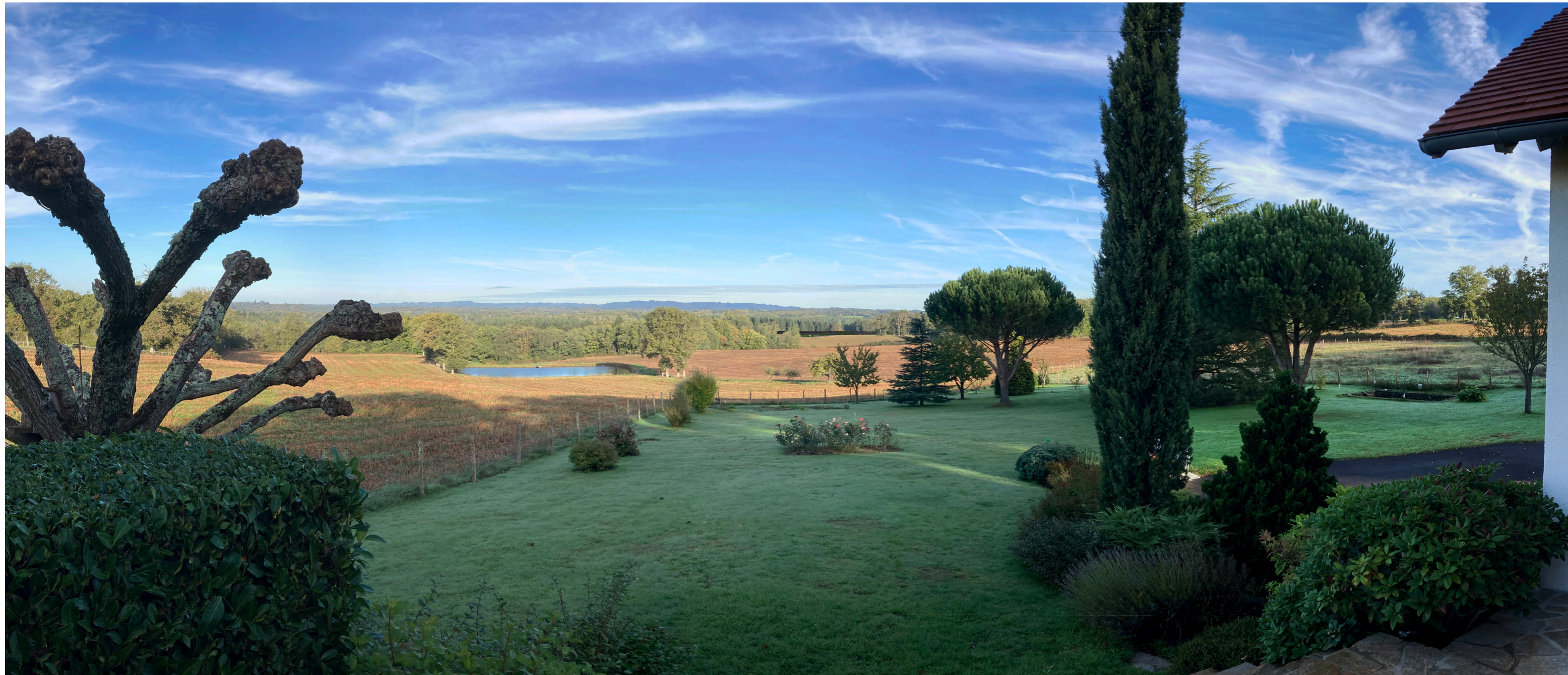
PV5 - Photomontage depuis le sud du projet, depuis la «maison Delhoume» - avec mesures paysagères (1 an)